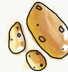
pomme de terre