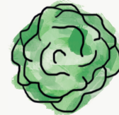
salade bataavia ; laitue