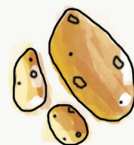
pomme de terre