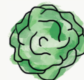
salade batavia ; laitue