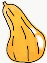
courge butternut ; muscade