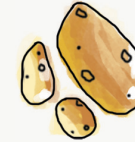
potato de terre